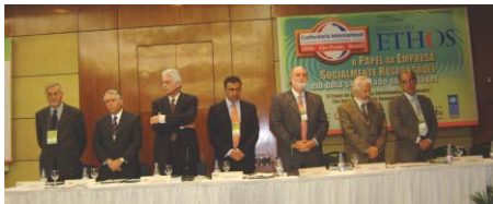
Importantes lideranças da sociedade civil e de organismos internacionais lançaram o Pacto Empresarial pela Integridade e contra a corrupção