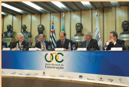
No lançamento da UNC, lideranças empresariais entregaram estudo ao candidato Geraldo Alckmin

ção de impostos e contribuições. A longo prazo, os efeitos seriam o aumento da taxa de investimento, da taxa de crescimento do PIB e do PIB per capita. Também seria elevada a expectativa de vida da população e o País atingiria um Índice de Desenvolvimento Humano (IDH) de 0,815, passando a integrar o grupo dos 50 países considerados de alto desenvolvimento.