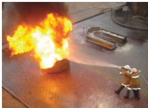
Competição entre equipes permite a demonstração prática das técnicas e conhecimentos adquiridos em treinamentos

“Todas as indústrias de tintas participantes podem ser consideradas vencedoras, pois o grande benefício do encontro é permitir às equipes de brigadistas a comparação com as demais participantes. Com isso, podem identificar as áreas onde precisam melhorar seu desempenho e aprender por meio de benchmarking , o que amplia o