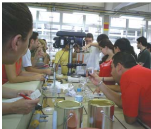
Aprimoramento técnico dos profissionais da indústria já é uma realidade, que precisa ser estendida aos aplicadores

“Nossa expectativa é alinhar as opiniões de associados, não associados e outras entidades de classe, buscando uma convergência. O intuito é promover um maior desenvolvimento setorial com propostas que sejam satisfatórias para todos e repercutam em um crescimento do mercado de tintas acima do apresentado nos últimos