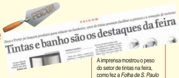
A imprensa mostrou o peso do setor de tintas na feira, como fez a Folha de S. Paulo

Com investimentos direcionados para promoção e lançamentos, indústrias apostam no crescimento do mercado e na conquista dos consumidores. Presença na maior feira da construção do País foi uma amostra dessa estratégia.