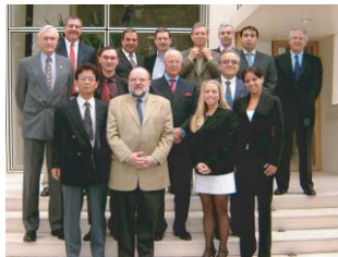
Participantes da reunião anual do Coatings Care Industry Stewardship Committee, durante a qual foram entregues as certificações

Numa cerimônia realizada no Hotel Emiliano, em São Paulo, ICI Packaging, Montana, PPG, Sherwin-Williams e Tintas Coral receberam a certificação de conformidade com o primeiro código do programa Coatings Care, referente à Produção (processo de manufatura). Essa certificação reafirma o compromisso das empresas com os aspectos ambientais, de segurança e saúde ocupacional.