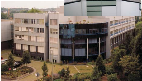
Fábrica da Byk em Wesel (Alemanha) e laboratório de Mauá: estrutura completa

A busca constante da inovação faz com que a empresa vista em profissionais altamente capacitados e em laboratórios de aplicação em todo o mundo, para desenvolver e testar novos processos e produtos em conjunto com seus clientes. Nesse horizonte, pesquisas com as mais modernas técnicas, incluindo a nanotecnologia e a polimerização controlada, fazem parte do cenário da BYK.